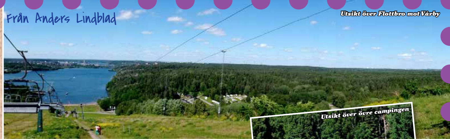
Utsikt över Flottbro mot Vårby