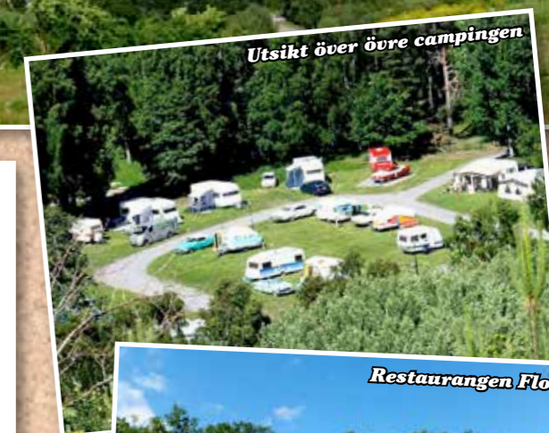
Utsikt över övre campingen