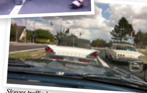
Slower traffic keep right