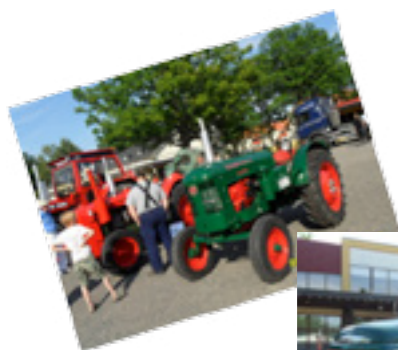
Här finns några bilder men fler finns på Facebook-Huskvarna Folkets Park.