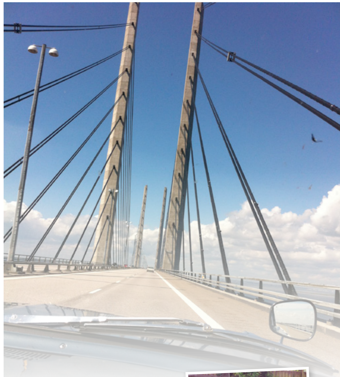
Högakustenbron i all ära, men vår lilla spång här nere tar oss utomlands

När sedan kärleken börjar kvittra halv sju på lördagsmorgonen kändes benen efter maratonmarschen på natten. En hemsk tanke slog mig – det är lika långt tillbaka. Detta börjar påminna om en hälsoresa. Det fick jag bekräftat senare på dagen när hela gänget åt middag nere på stan. Alla fick vad dom beställt utom jag. När hungern slet som vargar i min lille mage som