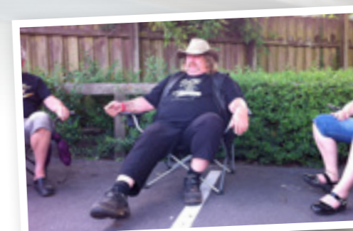
Presidenten har reserverad P-plats