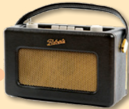
Roberts FM-radio www.houseofhedda.com

Om man stöter på farbror blå är det bäst att honom förstå!