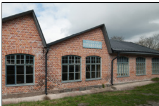
Motorfabriken Pythagoras verkstadsbyggnad.

Efter en konkurs 1927 nystartades företaget under namnet Nya AB Pythagoras. Företaget gick åter i konkurs under depressionen 1933, men ombildades därefter på nytt.