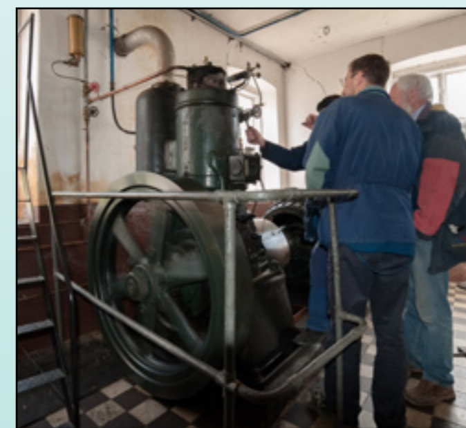
Demokörning av reservkraftverk "Drott SL-1" för drivning av fabriken. Stationär tvåcylindrig tändkula med en effekt av 40 hk och varvtal 400/min tillverkad 1932 i fabriken.