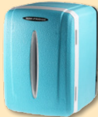
Kylskåp från www.coolstuff.se