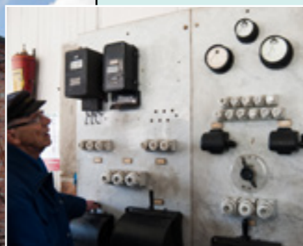
Marmortavlor till el-verket.