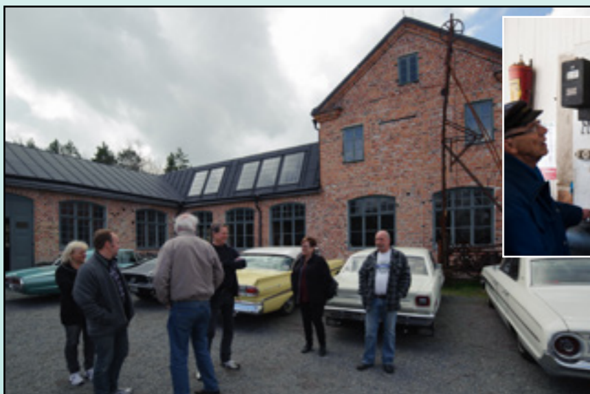
Ankomst till fabriksgården utanför verkstaden.