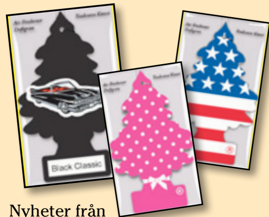
Nyheter från www.wunderbaum.se