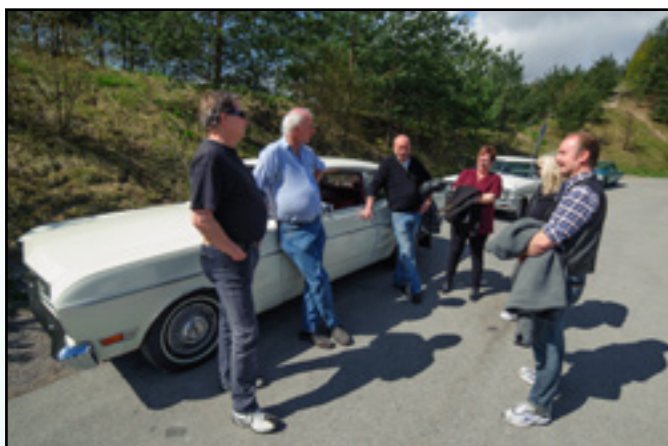
Samlingsplats vid Haga innan avfärd.

STOCKHOLMSSEKTIONENS GJORDE EN UTFLYKT till Pythagoras i Norrtälje den 5 maj. Samlingsplatsen var parkeringen vid Haga strax norr om Stockholm och avfärden mot Norrtälje skedde klockan 11.30.