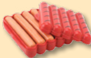
Förvaringslåda för korv www.houseofhedda.com