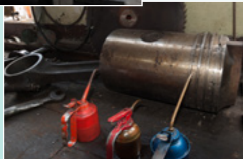
Kolv passande till Drott SL-1.